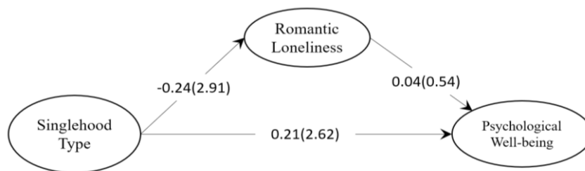
Figure 1. Experimental research model in the case of standard path coefficients (and t-value)

Figure 1 shows the model in the form of standardized path coefficients, with t values in parentheses.