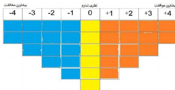
شکل ۱. جدول ۳۴ عاملی کیو